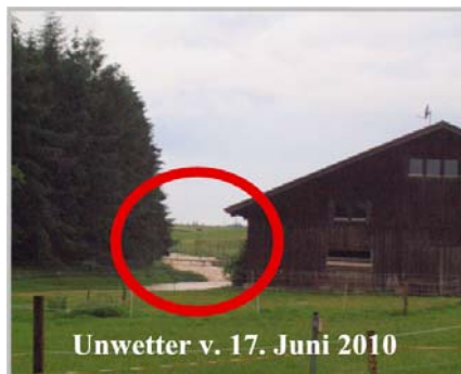
Wiese wurde zum Sturzbach

Für uns UWG-Gemeinderatsmitglieder ist es ein Selbstverständnis, dass wir zum Wohle der Allgemeinheit und nicht zum Vorteil Einzelner eintreten. Schon deshalb ist der geplante Standort der Biogasanlage für uns inakzeptabel.